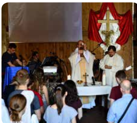
Hl. Messe in der Scheune