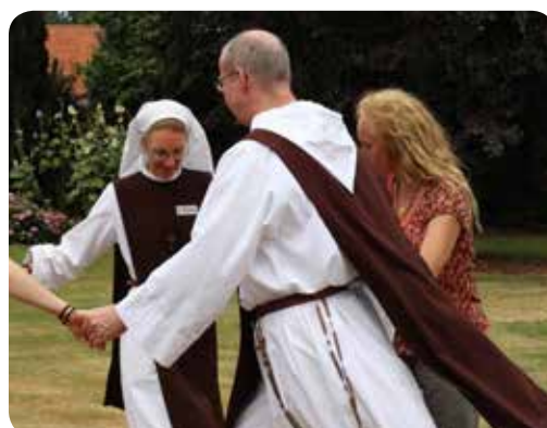
Workshop zu Israelischen Tänzen