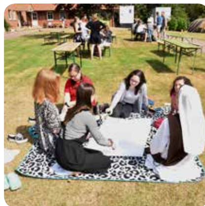
Gruppenarbeit im Freien